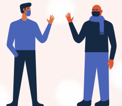
فوٽ جو مفاصلو 3