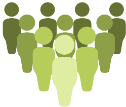
گهٽ ۾ گهٽ گنجائش 300

جيتوڻيڪ ڪيترن ئي ملڪن ۾ وڏن عوامي اجتماعن تي پابندي مڙهيل آهي، پر پاڪستان ۾ شادين، مذهبي گڏجاڻين ۽ ٻين وڏن عوامي جلسن ۽ واقعن جي انعقاد ڪري رهيو آهي. جيتوڻيڪ اهڙن گڏجاڻين جي موجودگي تي ڪا به پابندي لاڳو نه ڪئي وئي آهي، جڏهن ته اين سي او سي وڏن عوامي گڏجاڻين لاءِ هدايتون جاري ڪيون آهن، صوبن ۽ وفاقي حڪومت کي انهن هدايت نامن جي بنياد تي ايس او پيز ٺاهڻ جي هدايت ڪئي آهي. انهن رهنمائي واريون گڏجاڻين ۾ ماڻهن جي تعداد کي (300 تائين محدود ڪرڻ يا موجود گنجائش جو 50 سيڪڙو تائين) محدود رکڻ. تقريب جي مدت کي 3 ڪلاڪن تائين گهٽائڻ، شرڪت ڪندڙن جي وچ ۾ 3 فوٽ جي سماجي فاصلي کي يقيني بڻائڻ، شرڪت ڪندڙن لاءِ ويهڻ کي يقيني بڻائڻ ۽ هن ۾ انتظاميا کي ذميوار قرار ڏيڻ شامل آهي. شرڪت ڪندڙن کي ڏنل هدايتن جي عمل کي يقيني بڻائڻ، خاص طور تي ماسڪ پائڻ، سماجي مفاصلو ۽ ڪورونا وائرس جي حفاظت وارو ڪٽ مهيا ڪرڻ. هدايت نامي ۾ اهو به چيو ويو آهي ته ٻارن ۽ بزرگن کي شرڪت کان روڪيو وڃي، ساڻهه ڪٿڻ جي بيماري يا ڪورونا وائرس ۾ مبتلا ٿيل مريض يا ماڻهون کي اجازت نه ڏني ويندي، ۽ ڪنهن به قسم جي جلبي يا گڏجاڻي ۾ کائڻ پيئڻ جي اجازت نه هوندي.